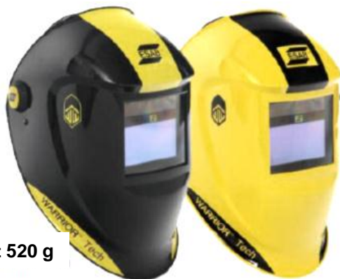
Vikt 520 g

Warrior™ Tech hjälmens har inbyggt batteri, som laddas av solceller. Detta innebär att batteriet laddas automatiskt och att du inte behöver byta batteri. Inbyggd energisparfunktion.